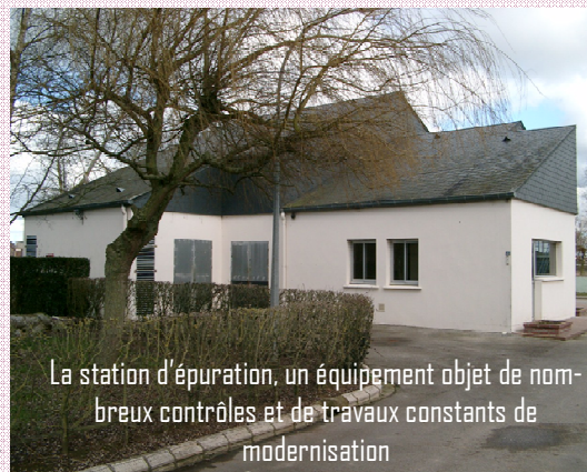
La station d'épuration, un équipement objet de nombreux contrôles et de travaux constants de modernisation

Par ailleurs, la commune fait réaliser des analyses régulières, par un laboratoire agréé, afin de surveiller le traitement des produits d'assainissement. La station et la plupart des postes de refoulement sont également pourvus de dispositifs d'autosurveillance et d'alarmes qui facilitent leur contrôle. La station d'épuration de St Valery présente des pourcentages d'épuration très satisfaisant et reçoit chaque année des primes liées à la qualité de son fonctionnement