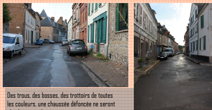
Des trous, des basses, des trottoirs de toutes les couleurs, une chaussée défoncée ne seront plus bientôt qu'un mauvais souvenir.