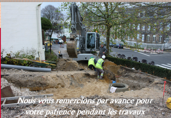
Nous vous remercions par avance pour votre patience pendant les travaux

Pendant toute la durée du chantier, la mairie, l'église, et les habitations des riverains resteront accessibles, au moins par le haut de la vieille ville (via les Tours Guillaume).