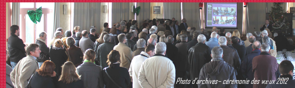
Photo d'archives - cérémonie des vœux 2012

Les fêtes de fin d'année sont une occasion supplémentaire pour que nous puissions nous rencontrer, et évoquer ensemble nos projets pour l'année à venir.