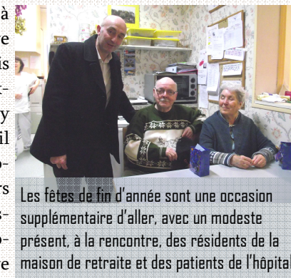
Les fêtes de fin d'année sont une occasion supplémentaire d'aller, avec un modeste présent, à la rencontre, des résidents de la maison de retraite et des patients de l'hôpital

Stéphane Haussoulier Maire de Saint-Valery-sur-Somme Président de la Communauté de Communes de la baie de Somme Sud