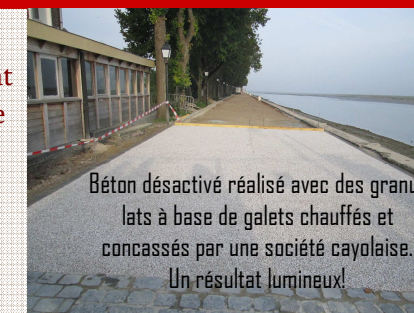
Béton désactivé réalisé avec des granulats à base de galets chauffés et concassés par une société cayolaise. Un résultat lumineux!

La réfection des quais Courbet et Jeanne d'Arc se poursuit. Pour votre sécurité et le bon déroulement du chantier, merci de respecter les interdictions de circuler, même à pied, dans la zone de travaux.