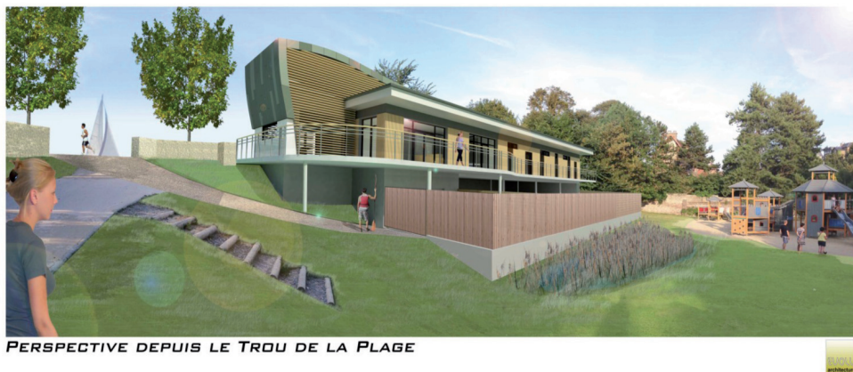
PERSPECTIVE DEPUIS LE TROU DE LA PLAGE

Depuis plusieurs années, les activités de pleine nature se sont développées sur le territoire de la Baie de Somme et plus particulièrement sur notre commune. Forte de sa centaine de licenciés et de ses amateurs occasionnels toujours plus nombreux, la pratique du kayak et de la pirogue est devenue une des activités phare des sports nautiques que nous pouvons proposer sur notre belle station. Afin de promouvoir davantage encore cette pratique sportive de loisir, la municipalité a décidé d'offrir à ses adeptes un équipement qui soit à la hauteur de leurs attentes et surtout de leurs besoins.