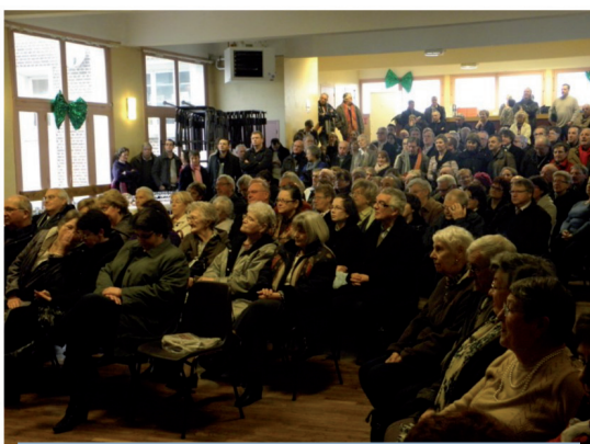
Photos d'archives cérémonie des vœux

En ce début d'année, je tenais tout d'abord à adresser mes meilleurs vœux à chacun d'entre vous. J'aurai l'occasion lors de la désormais traditionnelle cérémonie des vœux de les exprimer de vive voix à ceux qui auront pu se libérer pour y assister. Vous êtes toutes et tous chaleureusement conviés, salle du Casino, le samedi 10 janvier 2015, à 11 heures . Ce rendez-vous nous permet de faire le point sur l'année écoulée et de vous présenter tous les projets sur lesquels nous travaillons. Toutefois, je voulais vous redire, avec le conseil municipal, la passion qui nous habite pour œuvrer au quotidien à l'embellissement de notre ville, pour toujours mieux vous servir et répondre à vos attentes.