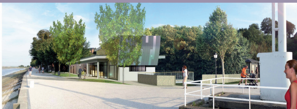
PERSPECTIVE DEPUIS LE QUAI JEANNE D'ARC