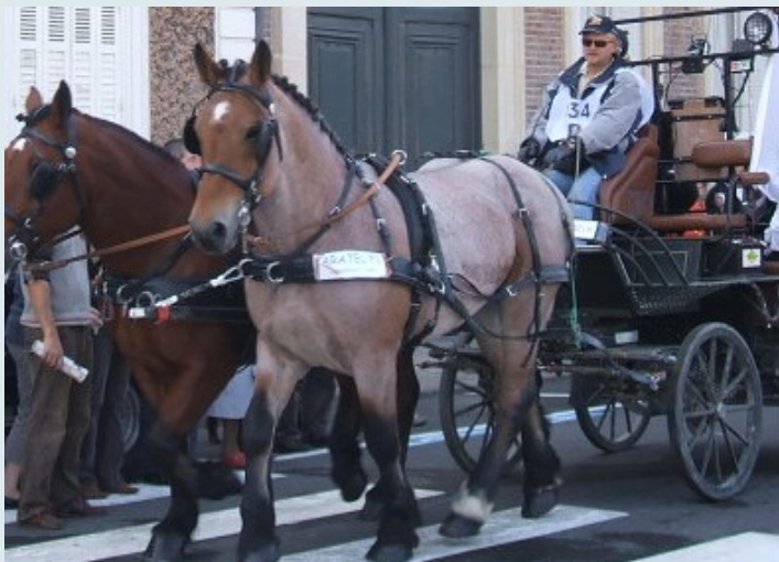
L'épopée évoque la valeur de ces raids (Photo d'archives).

Un groupe de passionnés des chevaux de trait rallume la flamme de la Route du poisson 2015. L'Épure et le Raid Somme conduiront ainsi les attelages de Boulogne et Conty à Saint-Valery-sur-Somme, le samedi 19 septembre. Les équipages devraient traverser la ville vers 16h30, des écluses vers les quais. Une confrontation de relais rapide se déroulera ensuite à la plage. Un beau spectacle en perspective.