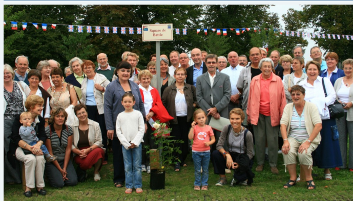
Inauguration du square de Battle le 29 août 2008

Guy Grognet souhaite que l'association continue avec du sang neuf. Toutes personnes intéressées par les échanges et les cours d'anglais ou ayant des suggestions pour développer d'autres activités, sont les bienvenues.