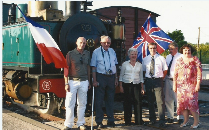
Locomotive pavoisée pour les 40 ans de l'association