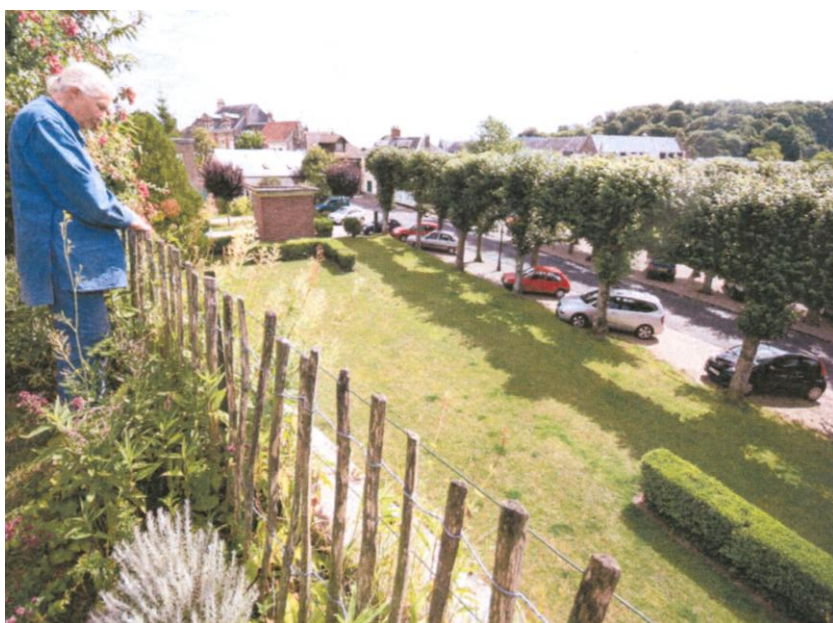
Emplacement du fruticetum, vu depuis l'Herbarium. Une parcelle trapézoïdale en pente de 810 m 2 environ.